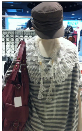
(左) 7,350円 (右) コーディネート例 以上 渋谷パルコ PART3/And Accessoire

(※1)チュール素材…細かい網目模様の薄手生地。絹、綿、ナイロンなどが用いられる。 ウェディングドレスのベールや、飾りに用いられることが多い。