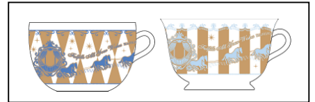
※コーヒーカップ、ティーカップ イメージ

期間中、店内でご飲食の方にマジヨリカ マジヨルカの商品をお試しいただける特設メーキャップブースが登場します。