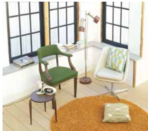
LOUNGE4 ラウンジフォー(インテリア・雑貨)