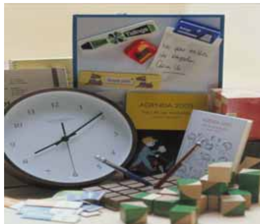
graphia グラフィア(雑貨・ステーショナリー)