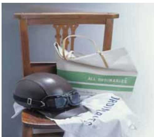
ALL ORDINARIES オールオーデナリーズ(雑貨・レディス・メンズ)