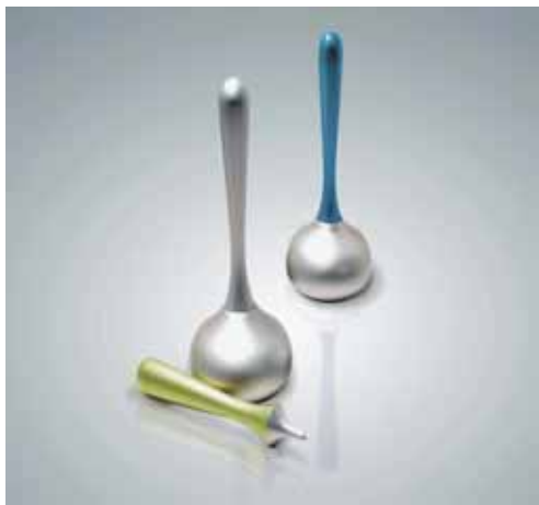
ACME アクメ(デザイン雑貨)

【B1F ゾーン】都心生活を楽しむ男女に向け、B1F はシングルライフを応援するルームスタイリング(インテリア雑貨・身の回り)など生活を楽しむパーツを提供いたします