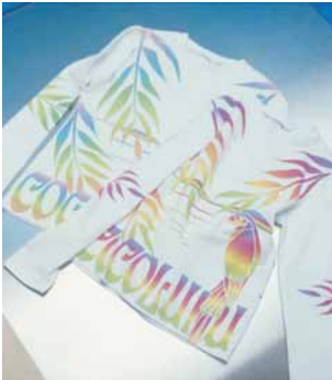
COCOLULU SQUARE ココルルスクエア

【3F・ドメスティックキャラクター & デニムスタイル】ティーンを対象とした「キャラクターカジュアル」「ドメスティックデニム」「スポーツ」ファッションを提案