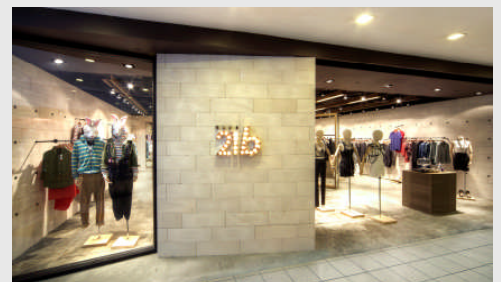
CLUB21 はシンガポールを拠点に、1970年代から日本や欧米を中心としたハイエンドブランドを取り扱っている。現在はインドネシア、マレーシア、タイ、香港、台湾、中国、アメリカ、イギリスなどに展開。