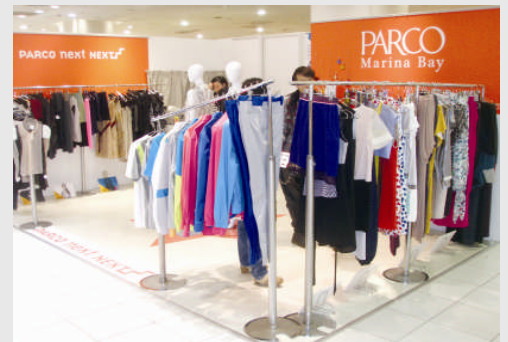
2009年よりシンガポール政府と協業し、現地の次世代デザイナー支援プログラム「パルコネクストネクスト」を実施。2012年には参加ブランドの期間限定ショップを渋谷 PARCO で開催。