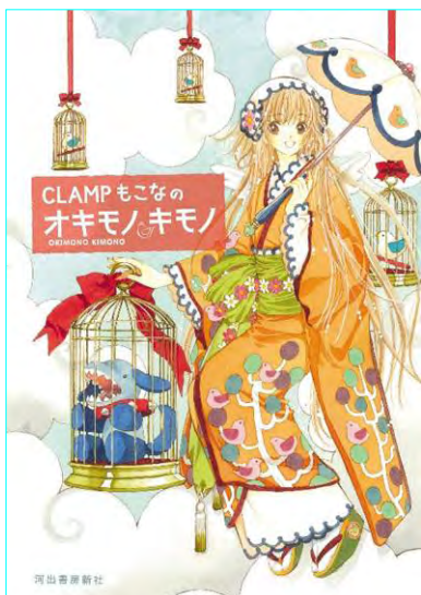
イラスト/CLAMP (C) 2007 CLAMP/河出書房新社

『xxxHOLiC』、『ツバサ』など、大ヒットマンガを連発する創作集団 CLAMP。“もこな”は、絵の美しさや緻密さでも評判の高い CLAMP 作品の作画を担当しています。