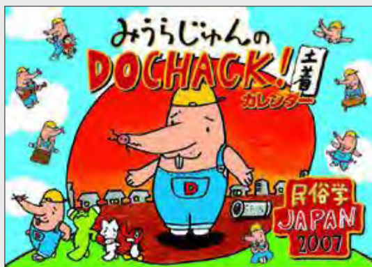
イラスト:リリー・フランキー