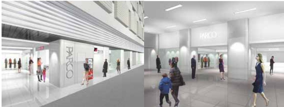
〔完成イメージ図〕 写真左 ：1F 明治通り側 写真右 ：1F JR コンコース側

また同時に 1F のテナントも全面的に改装し、まったく新しいショッピングゾーンにリフレッシュいたします。（詳細は、最終ページ添付の別紙資料をご参照ください）