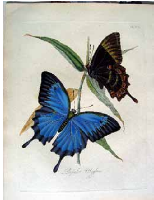
ドノヴァン「インド昆虫誌」

開催概要 期間 : 2005年3月1日(火)～14日(月)会期中無休 開場時間 : 10:00～21:00 (最終日は17:00まで)