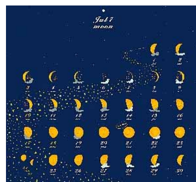
写真左 - 「スローフードカレンダー」(1,575 円・税込) 写真中 - 「御教訓カレンダー」(1,365 円・税込) 写真右 - 「ムーンカレンダー」(1,680 円・税込)

その他、「卓上ムーンカレンダー」(840 円・税込)、「お天気ケ 口太の 2005 むかしばなしカレンダー」(1,155 円・税込)、「今 日は何の日」カレンダー(1,155 円・税込)も好評発売中。