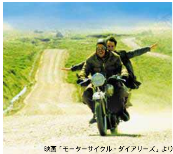
映画「モーターサイクル・ダイアリーズ」より。

若き日のゲバラを大きく変えるこの冒険の旅を、美しい映像と共に綴った映画「モーターサイクル・ダイアリーズ」の公開を記念し、本展では青年時代から美しき革命家となるまでにいたるチェ・ゲバラの人生を、貴重な写真とパネルで展示。そのほか、チェ・ゲバラに関する貴重な品々の展示などを予定しており、会場では彼の人生を肌で感じることができます。