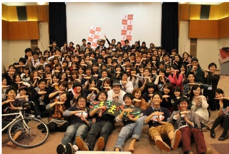
2011年世界食料デーキャンペーン締めくくりイベント

http://www.tablefor2.org/supporter/tftua.html