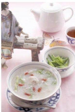
上:総合中華 唐菜 若鶏の中華粥 880 円(調布店)