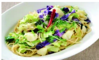
上:ベーベの気持ち「ミルクソフト」320 円(福岡店) 中下:ピッツァ&パスタ パパミラノ 「野菜いっぱいのペペロンチーノ」980 円(浦和店)