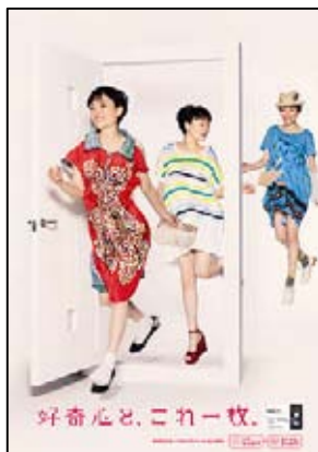
※キャンペーンポスター(イメージ)