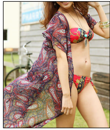
(左) (中) UVパーカー ¥6,195...紫外線を95%以上カット【PEAK&PINE】 (右) ロング丈ガウン ¥9,345...目新しいシルエットとデザイン【三愛水着樂園】