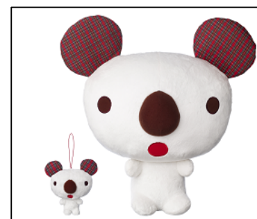
(上右)パルコアラジャンボぬいぐるみ 縦43cm 横43cm