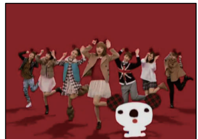
(ご参考)2011年冬グランバザールCM「パルコアラダンス」