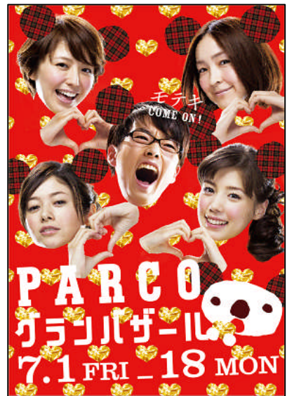
2011 夏グランバザールポスタービジュアル