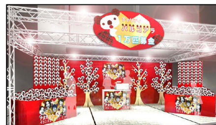
(上)販売会場イメージ/木の形をした仕器を設置しパルコアラを展示します。