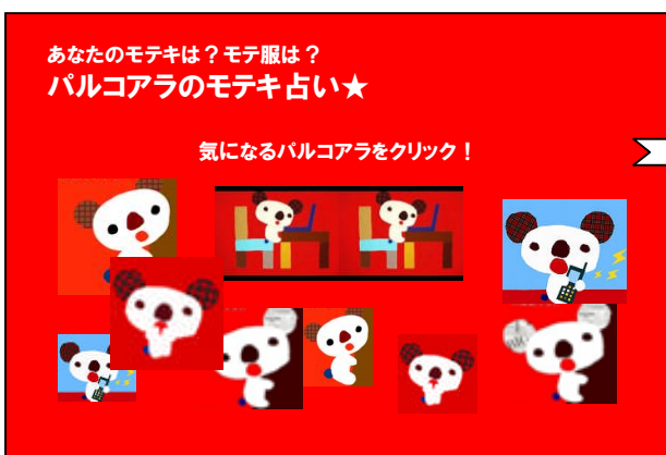
(左) 占いコンテンツ TOP イメージ

パルコアラがモテキがくる期間や運勢を占うとともに、おすすめファッションアイテムのご紹介をいたします。