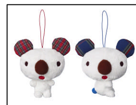
(上)ぬいぐるみ 縦12cm 横11cm