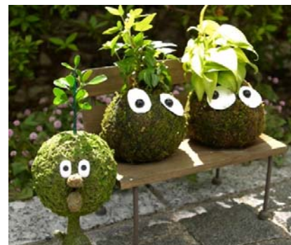
(上) コケ玉 イメージ

(※出来上がったコケ玉の写真をパルコのバレンタイン特設サイトに投稿すると、審査の結果、特設サイトにて披露される予定です)