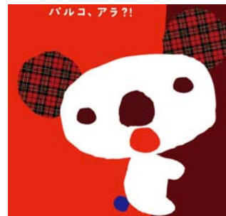
(右) パルコアライメージ

2010年冬のグランバザールからキャラクターとして登場しています。買い物好きでトレンドに敏感なコアラで、木の上からパルコのお店を観察したり、ウェブサイトをチェックしたりする根っからのオシャレっ子です。2011年も引き続き、グランバザールのナビゲーターとして活躍します。