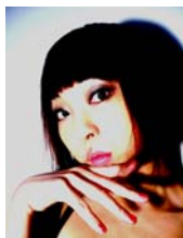
<MIKIKO先生プロフィール>

Perfumeの振り付・ライブ演出を手掛ける他、様々なCM・PVの振り付を行う。 『五感に響く作品作り』がモットー。