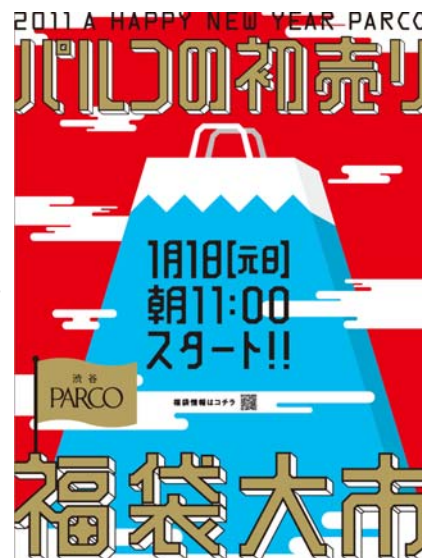
(上) ポスターイメージです

< www.parco-city.com/special/happybag/index.html >