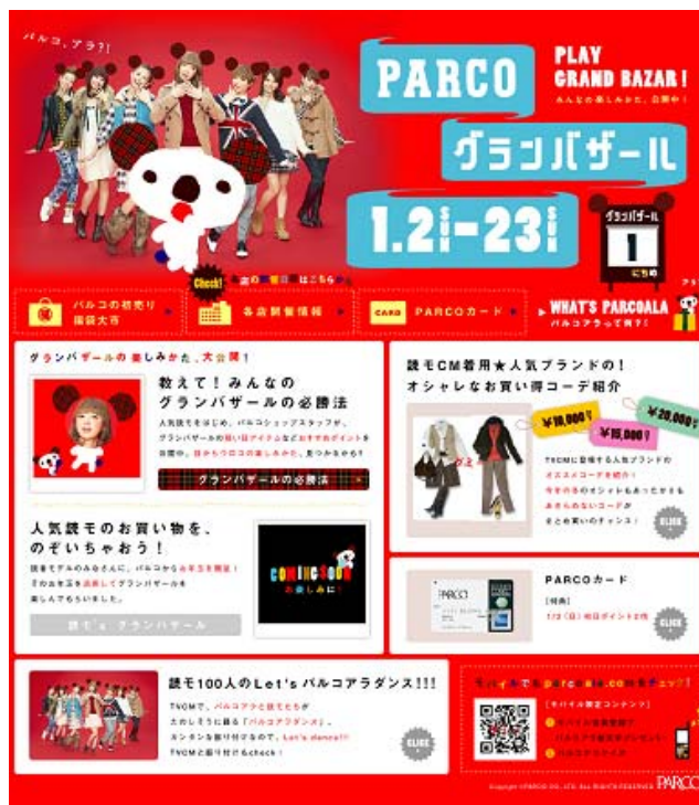
(上) グランバザール特設サイトイメージです