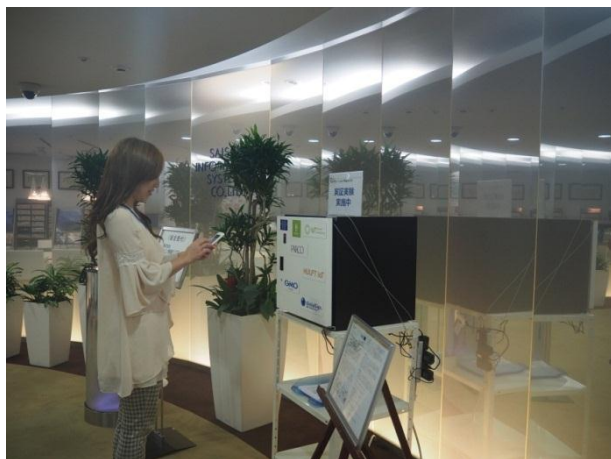
【参考】2017年5月の株式会社セゾン情報システムズのオフィスビル内での実証実験の様子

今回のロッカー受け取りサービスの試験的な導入は、2017年5月に株式会社セゾン情報システムズ（東京都港区）のオフィスビル内で実施した実証実験を踏まえたもので、実際に池袋 PARCO にロッカーを設置してお客様にもご利用いただくことでその利便性やサービス価値を確認することが目的です。今後は、今回のテスト運用の結果をもとに、システムやサービスの改修・改善を行い、お客様のお買い物の利便性を高める新たな選択肢として、本格導入や他店舗への設置等を検討していく予定です。