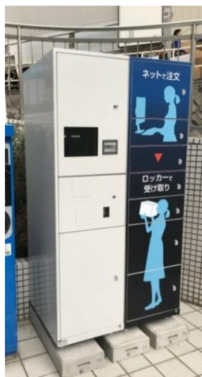
【ロッカー設置イメージ】

今回導入するブロックチェーン技術を活用した宅配ボックスソリューションのような、高水準のセキュリティを担保するロッカー受け取りサービスの提供により、お客様は「いつでもどこでも商品が購入でき、安心・安全に好きな時間に受け取ることができる」という利便性を享受できます。また、ロッカー受け取りサービスの導入は、近年顕在化している物流問題を回避しながらも、商品の受け取り方法を拡充することで新たなサービスの創出につながり、パルコが推進する「24時間 PARCO」におけるお客様とのコミュニケーションチャネルの強化にも結び付くと考えています。