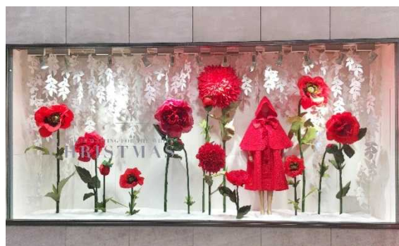
名古屋PARCO 西館 正面ウィンドウ