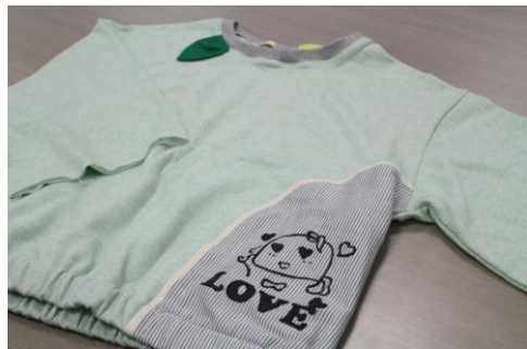
ふなっしーリメイクトップス(仮) ※イメージ画像