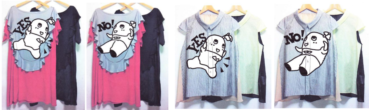
ふなっしーカットソーワンピース(仮) ※イメージ画像