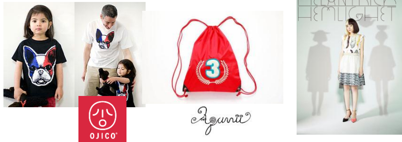
OJICO / Aquvii / メランリックヘムラ