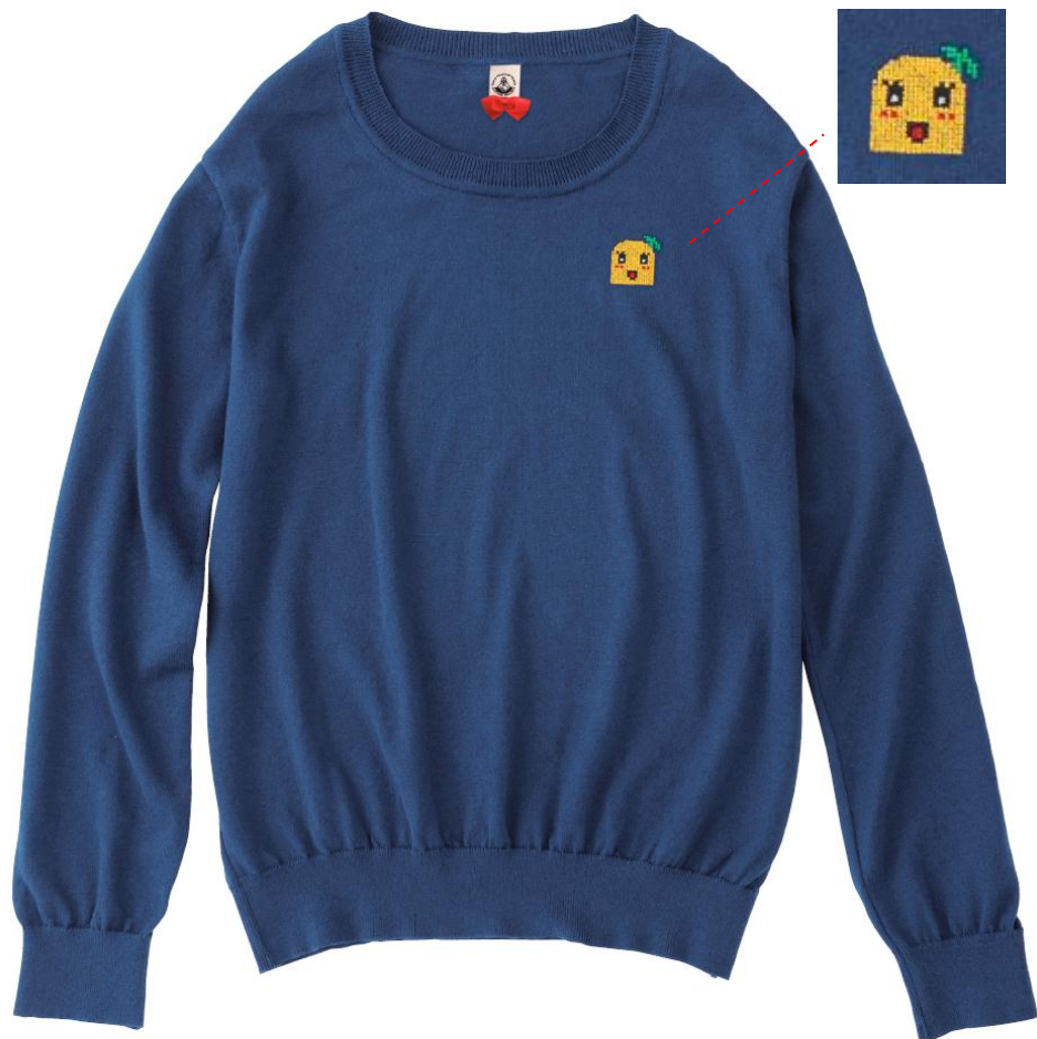
オーガニックコットン ふなっしーニット 6,500円+税（うち300円は基金） サイズS/M/L 1色のみ※レディース ※店舗限定ノベルティ付き ◎ふなっしー