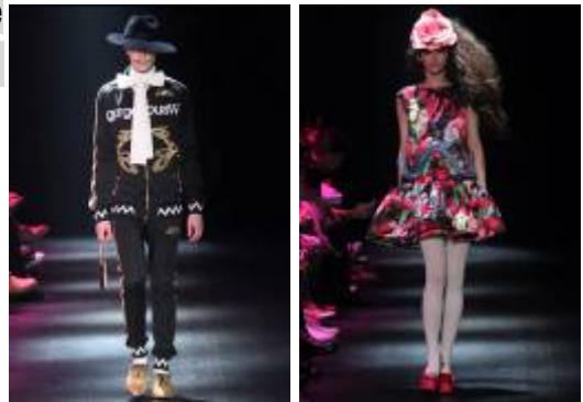
2014年3月に東京コレクションで披露された14AWランウェイショー

The Threepenny Opera のドイツアヴァンギャルドなムードに、ルキノ・ヴィスコンティのイタリアンデカダンスを加えた Theatrical な世界観をモダンに表現したコレクション。