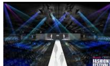
ランウェイショー会場

(主催) シンガポール政府観光局 シンガポールテキスタイル&ファッション協会 マーキュリーマーケティングアンドコミュニケーションズ