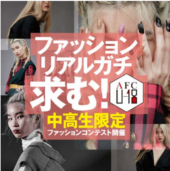
- 『AFC U-18』キービジュアル-

株式会社バンタン（本部：東京都渋谷区）と株式会社パルコ（本部：東京都渋谷区）は、アジアの若手デザイナーを発掘・インキュベートするプロジェクト「Asia Fashion Collection（アジアファッションコレクション、以下AFC）」の次世代ファッション人材の育成を目的として、中高生を対象としたファッションコンテスト『AFC U-18（エーエフシー ユーイチハチ）』の開催を決定。2018年6月27日(水)より参加者の応募を開始いたしました。