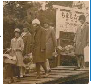
田無町駅と自由学園生