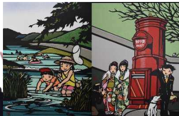
落合川(東久留米市) / 日本一のポスト(小平市)