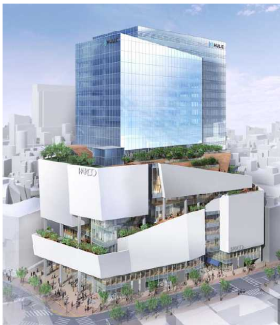
完成イメージと用途計画